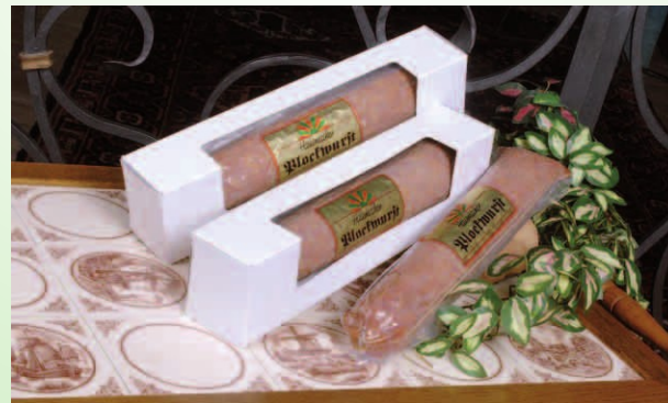
Nr. 810 ca. 1,0 kg Hausmacher Plockwurst in Präsent-schachtel 13,00 € zzgl. MWSt.