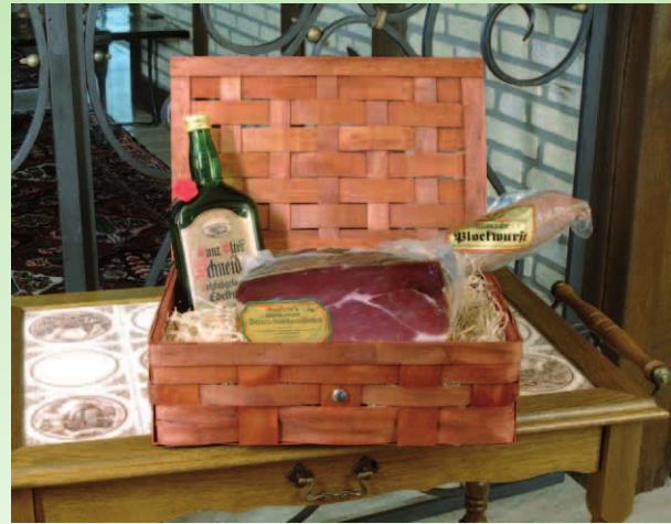
Nr. 809 ca. 1,5 kg Schinken geräuchert oder luftgetrocknet ca. 1,0 kg Hausmacher Plockwurst 0,7 l Ganz Alter Schneider im Korb 53,40 € zzgl. MWSt.