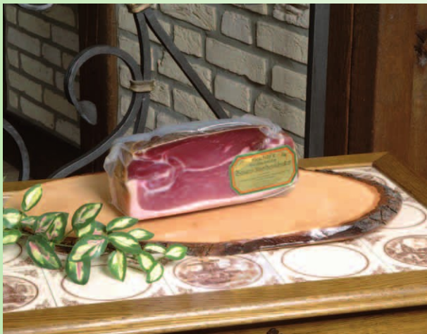
Nr. 808 Holzbrett mit ca. 1,0 kg Schinken geräuchert oder luftgetrocknet im Umkarton 28,20 € zzgl. MWSt.