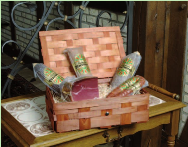
Nr. 807 ca. 0,5 kg Schinken ca. 0,5 kg Hausmacher Leberwurst ca. 0,5 kg Hausmacher Blutwurst ca. 0,5 kg Hausmacher Plockwurst ca. 0,4 kg Bauernmettwurst im Korb 32,70 € zzgl. MWSt.